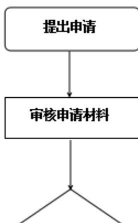
第二类医疗器械经营备案办事流程图